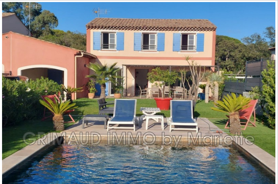
Huis 700 Grimaud