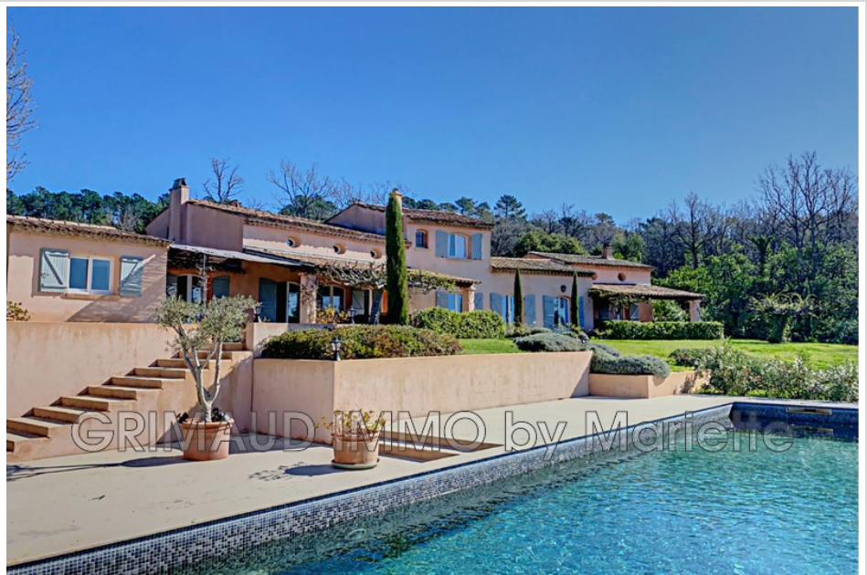
Villa 756 La Garde-Freinet

Villa op ongeveer 2 ha grond met prachtig open uitzicht over de bergen bestaande uit een hal, een grote woonkamer met uitzicht op de eetkamer, een keuken (bijkeuken en inloop koelkast) een kantoor, een grote ouder slaapkamer met eigen badkamer en dressing, op de eerste verdieping zijn er drie slaapkamers met badkamer eigen badkamers. Een studio met badkamer en kitchenette. Kelder. Mooie overdekte terrassen met uitzicht op het zwembad. uniek gelegen en een panoramisch uitzicht